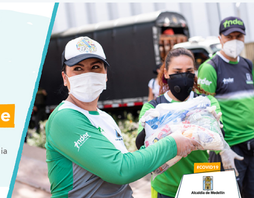
Medellín me cuida

para que la Alcaldía de Medellín pueda cuidarte mejor a ti y a tu familia durante la crisis del coronavirus