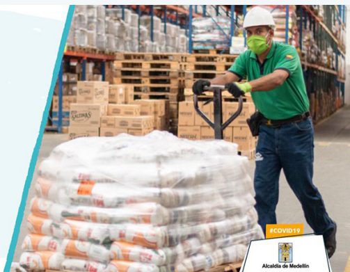
Medellín me cuida - Empresas

para que la Alcaldía de Medellín pueda cuidarte mejor a ti, a tu empresa y a tus empleados durante la crisis del Coronavirus.